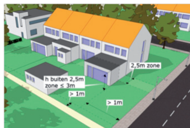
Buiten de 2,5 meter zone

Als er door de bouw van een bijbehorend bouwwerk een ruimte ontstaat die de 2,5 meter zone overschrijdt, dan geldt voor die gehele ruimte de eis van een ondergeschikt gebruik. Alleen als de ruimte binnen of ter hoogte van de 2,5 meter zone wordt afgescheiden met een scheidingsconstructie (muur of pui), kan de ruimte gebruikt worden voor de uitbreiding van de primaire functie van het hoofdgebouw, bijvoorbeeld als woonkamer.